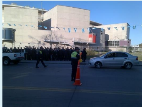
ANSV - GUAYMALLÉN