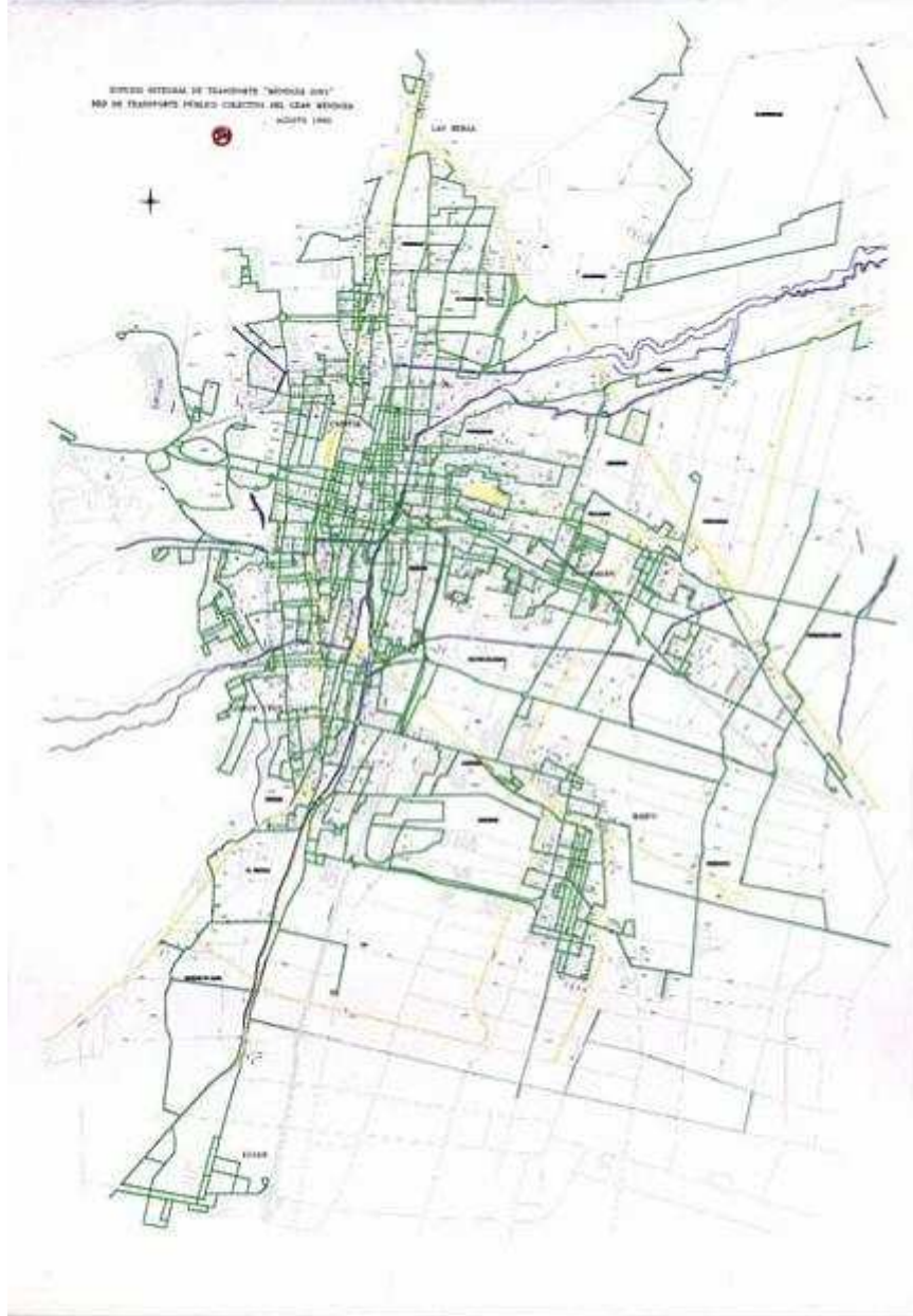
Figura 1: Red de transporte público colectivo del Gran Mendoza 1999.

Fuente: Secretaría de Servicios Públicos, Ministerio de Infraestructura, Vivienda y Transporte, Gobierno de Mendoza